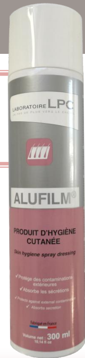
Spray de 300 ml

PRESENTATION EN SPRAY FACILE ET PRATIQUE D'UTILISATION