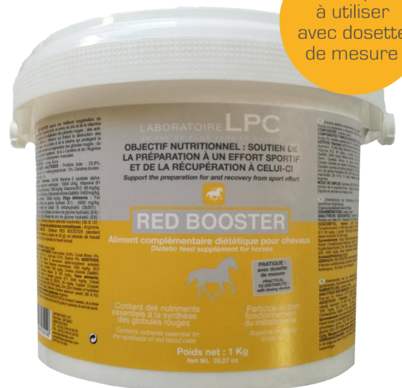
Présentation poudre Pot de 1 kg

Pratique à utiliser avec dosette de mesure