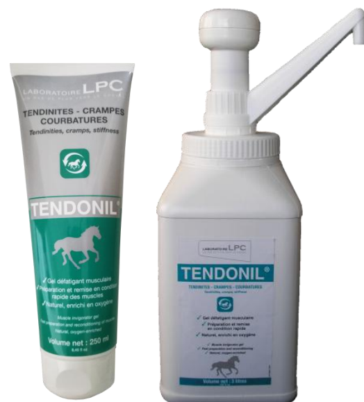
Tube de 250 ml Pot de 3L avec pompe doseuse

Le manque d'entraînement favorise l'apparition de tendinites, de courbatures et de contractures musculaires. L'utilisation de ce gel enrichi en oxygène facilite l'élimination des toxines tissulaires accumulées pendant l'effort et diminue les microtraumatismes.