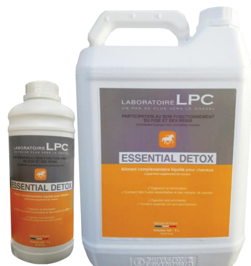
Bidon de 1L Bidon de 5L avec bouchon doseur

ESSENTIAL DETOX est particulièrement préconisé lors des changements d'aliment, les périodes d'activités sportives intenses et pour contribuer à la relance de l'appétit chez les chevaux convalescents ou seniors.